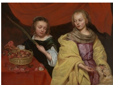
Michaelina Wautier Zwei Mädchen als hl. Agnes und hl. Dorothea um 1655 Öl auf Leinwand, 89,7 × 122 cm Königliches Museum für Schöne Künste Antwerpen – Flämische Gemeinschaft