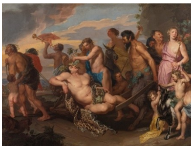
Michaelina Wautier Der Triumph des Bacchus 1655/59 Öl auf Leinwand, 271,5 × 355,5 cm Kunsthistorisches Museum, Gemäldegalerie

Pressefotos zur aktuellen Berichterstattung stehen auf unserer Website press.khm.at zum freien Download bereit.