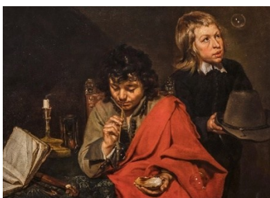
Michaelina Wautier Jungen beim Seifenblasen 1650/55 Öl auf Leinwand, 90,5 × 121,3 cm Seattle Art Museum, Schenkung von Mr. Floyd Naramore