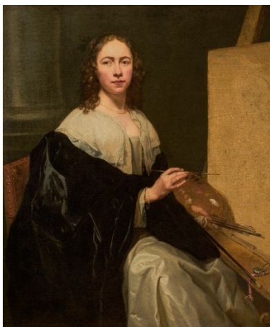
Michaelina Wautier Selbstporträt um 1650 Öl auf Leinwand, 120 × 102 cm Privatsammlung