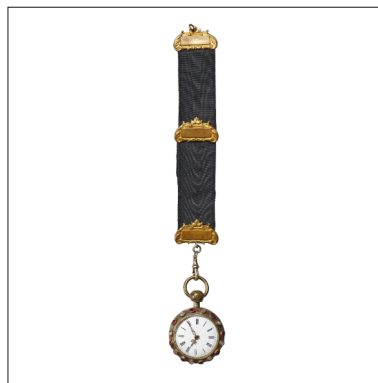
Taschenuhr mit Kette Requisit zu Die Fledermaus von Johann Strauss Theater a. d. Wien, Uraufführung 1874