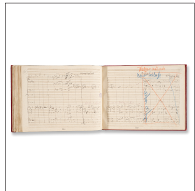
Originalpartitur Die Fledermaus von Johann Strauss (aufgeschlagen)