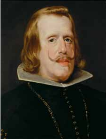
Diego Velázquez, König Philipp IV. von Spanien, KHM