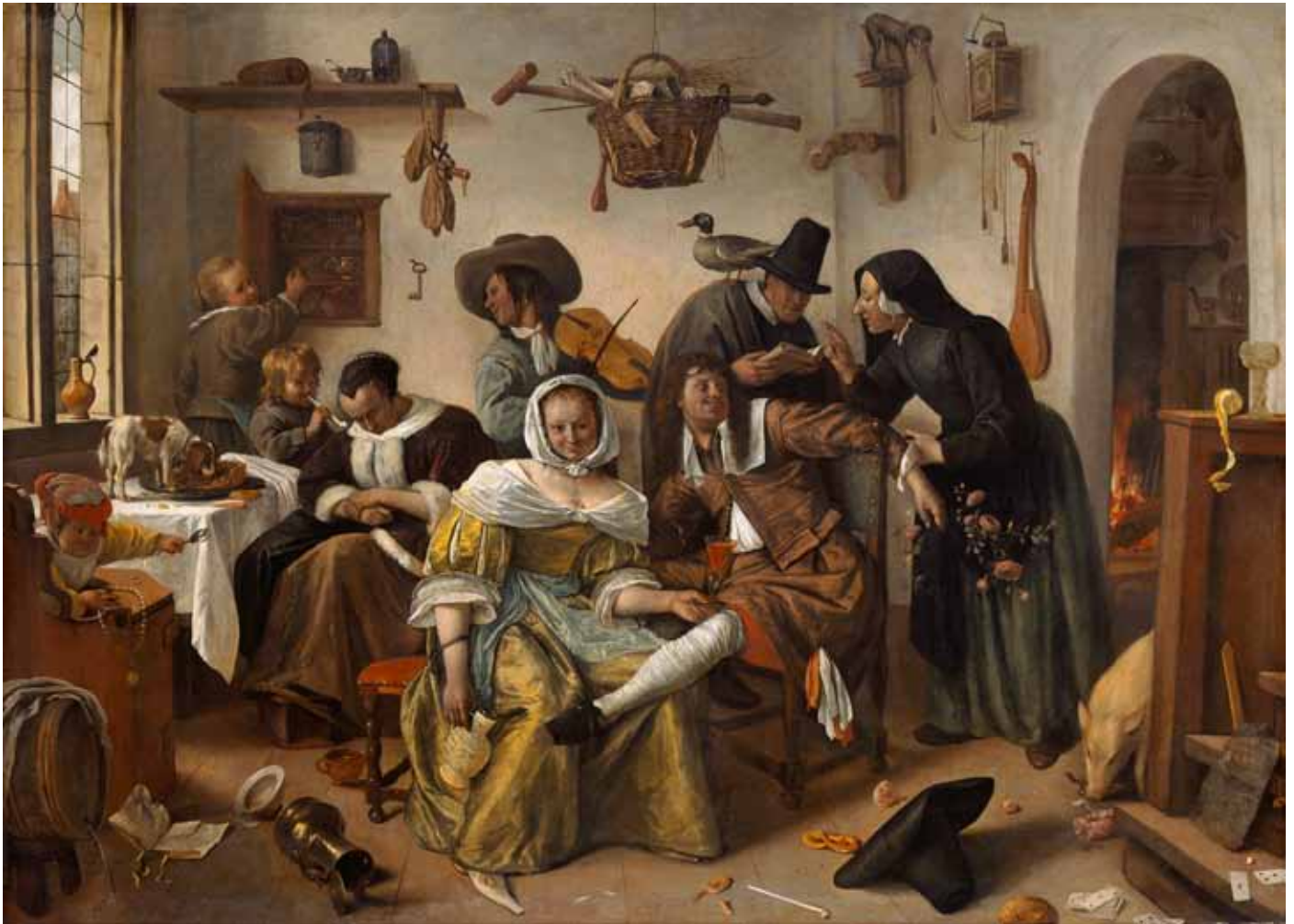
Die verkehrte Welt 1670 Leinwand, 57 x 68 cm

Jan Steen ist ein Zeitgenosse von Pieter de Hooch und Gerard ter Borch und damit ein weiterer Vertreter der Malerei des Goldenen Zeitalters in Holland. Im Gegensatz zur besinnlichen Stimmung der Werke Gerard ter Borchs schildern Jan Steens Gemälde unverfälscht das Leben.