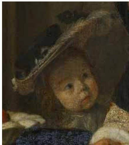
Gerard ter Borch, Apfelschälerin, Detail , KHM

Gerard ter Borch ist einerseits ein Meister der stofflichen Schilderung. Die haptischen Qualitäten des Tischtuches, des Pelzbesatzes, der verlockend knackigen Oberfläche der Früchte und des edlen Metalls des Kerzenleuchters lassen alle Gegenstände real erscheinen und wecken im Betrachter den Wunsch, tatsächlich nach den Dingen zu greifen. Andererseits ist er auch ein Meister der Farben. Dank des Zusammenspiels von kühlen Grau-, Beige- und Blautönen, die nur vom Gelb der Jacke und dem Rot der Äpfel kontrastiert werden, schafft der Maler eine Stille und Ruhe, die die zarte und innige Verbindung zwischen Mutter und Kind in berührender Weise wiedergibt. Genau diese Begabungen zeichnen die holländische Malerei dieser Zeit aus (s. Gerard ter Borch, Die Briefschreiberin , KHM).