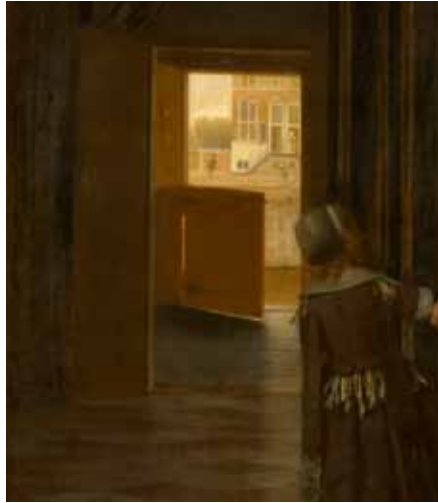
Pieter de Hooch, Frau mit Kind und Dienstmagd , Detail