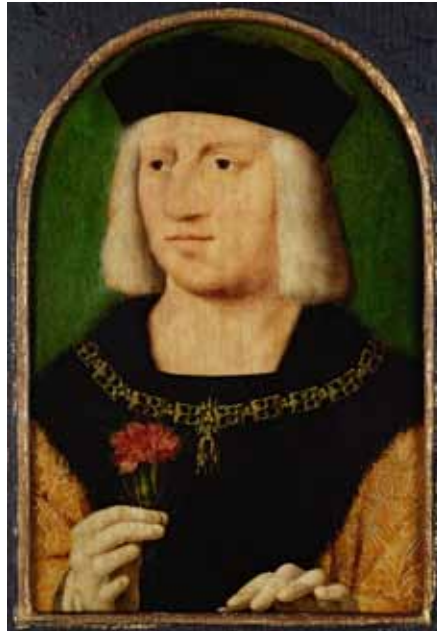
Joos van Cleve, Kaiser Maximilian I , KHM

Porträts von so hoher Qualität gehörten damals an den europäischen Fürstenhöfen zu den weit verbreiteten Werbegeschenken zur Partnerfindung. Meist hält die Dame oder der Herr eine Blume in der Hand. Auch im bürgerlichen Milieu sind derartige Werbebilder verbreitet.