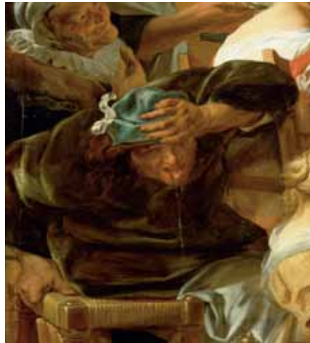
Jacob Jordaens, Das Fest des Bohnenkönigs, Detail