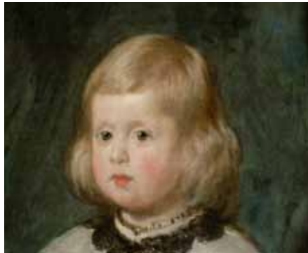
Diego Velázquez, Infantin Margarita Teresa in rosafarbenem Gewand, Detail