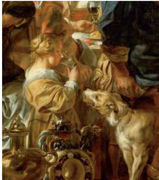
Jacob Jordaens, Das Fest des Bohnenkönigs , Detail