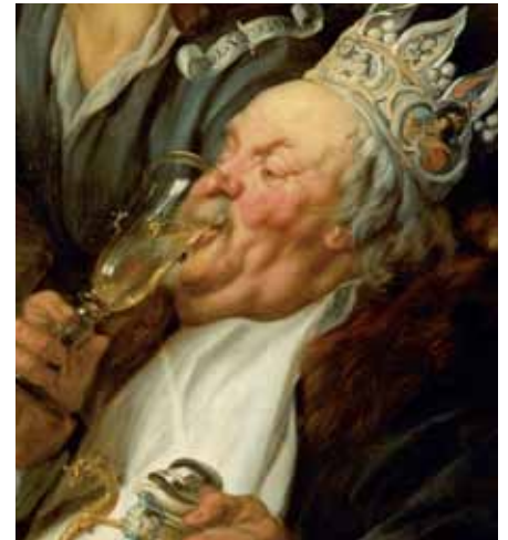
Jacob Jordaens, Das Fest des Bohnenkönigs, Detail