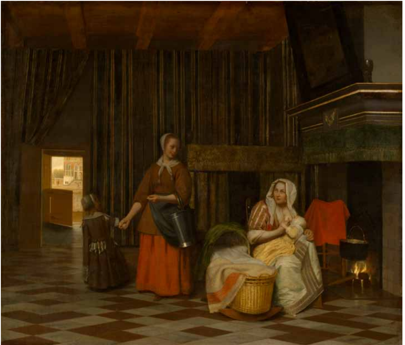
Frau mit Kind und Dienstmagd

Pieter de Hooch ist einer der zahlreichen Vertreter des Goldenen Zeitalters der holländischen Malerei im 17. Jh. Zusammen mit Jan Vermeer van Delft, Rembrandt (beide im KHM vertreten) und Gerard ter Borch (s. dort) vertritt er die Genremalerei, deren Wertschätzung damals besonders groß war.