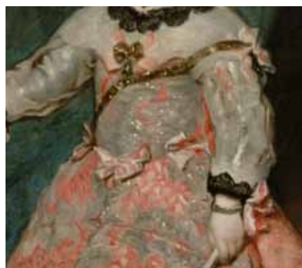
Diego Velázquez, Infantin Margarita Teresa in rosafarbenem Gewand, Detail

Velázquez gilt als Revolutionär der Porträtmalerei. In der europäischen Malerei dominierte damals das repräsentative Erwachsenenporträt, das auch die spanische Gesellschaft bevorzugte. Umso bedeutender ist die Tatsache, dass Velázquez gerade dem Kinderporträt seine Aufmerksamkeit schenkte. Er verstand es meisterhaft, die Ansprüche des offiziellen Porträts mit der Natürlichkeit eines Kindes dieses Standes in Einklang zu bringen. Elegante, zurückhaltende Distinktion paart sich ganz selbstverständlich mit der unbekümmerten Frische des Naturalismus. Diesen harmonischen Gleichklang zweier unterschiedlicher Sehweisen erzielte Velázquez durch die Verlebendigung seiner Malweise. Keiner seiner Zeitgenossen pflegte damals eine derartig offene Pinselführung. Das lachsfarbene Kleid der Infantin scheint aus unzähligen Pinseltupfen zusammengesetzt. Einzelne weiße Lichthöhungen geben dem Stoff die haptische Lebendigkeit. Beinahe wird das Rascheln der Seide hörbar. Je näher der Betrachter vor dem Gemälde steht, desto aufgelockerter erscheint die Maloberfläche; je größer die Distanz zum Bild ist, desto konkreter wird die Komposition. Ganz unbewusst übte Velázquez eine Sehweise, die 200 Jahre später in Frankreich von den Impressionisten gepflegt wurde.