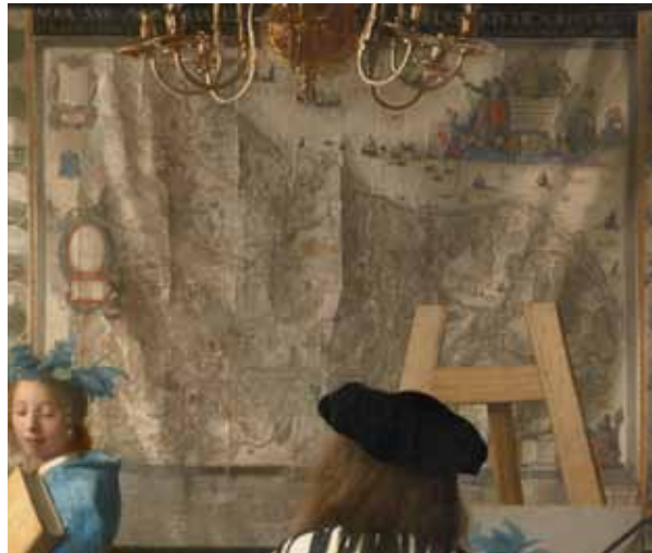
Jan Vermeer van Delft, Die Malkunst , Detail, KHM