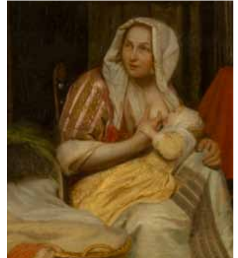
Pieter de Hooch, Frau mit Kind und Dienstmagd , Detail