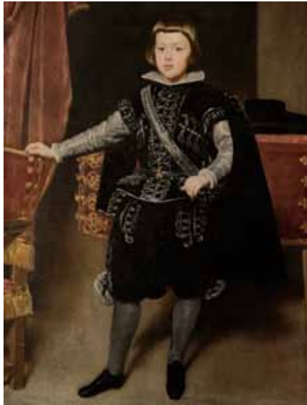
Diego Velázquez, Infant Balthasar Carlos, KHM