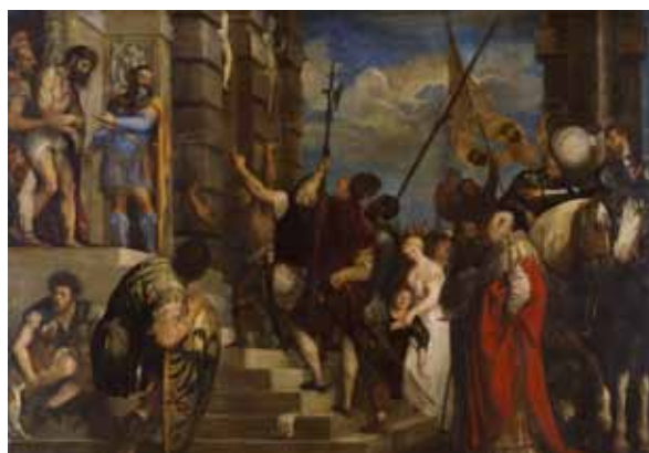
Tizian, Ecce homo , KHM

Von größter Bedeutung war zur Zeit Pieter Bruegels d. Ä. die Erkenntnis, dass Schilderungen des Alltags, der Feste und Bräuche der Menschen das Interesse der Sammler wecken konnte. Mit diesen Werken öffnete der Maler eine völlig neue Sicht auf seine Umwelt, zumal er sehr oft kritische Kommentare einfließen ließ. Kein Künstler je zuvor, weder nördlich noch südlich der Alpen, nahm derartig ausführlich auf das zeitgenössische, alltägliche Geschehen Bezug. Bruegel setzte damit einen wichtigen Schritt in der Entwicklung der Genremalerei, die in den kommenden Jahrhunderten eine bedeutende Rolle spielen sollte. (Ein Vergleich Bruegels mit Zeitgenossen, zum Beispiel mit Tizian, KHM / Saal I, bestätigt seine fortschrittliche Denkweise. Südlich der Alpen überwogen damals nach wie vor religiöse und mythologische Themen sowie das Porträt.)