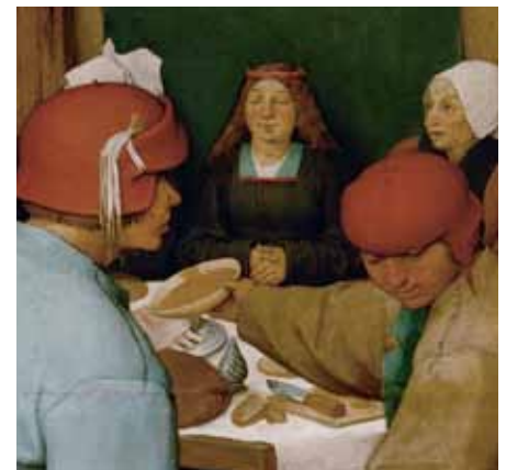
Pieter Bruegel d. Ä., Bauernhochzeit , Detail