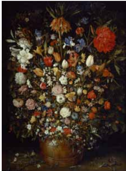
Jan Breughel d. Ä., Großer Blumenstrauß in einem Holzgefäß, KHM