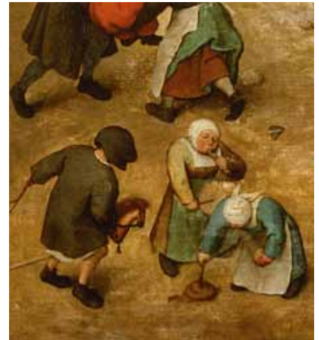
Pieter Bruegel d. Ä., Kinderspiele , Detail