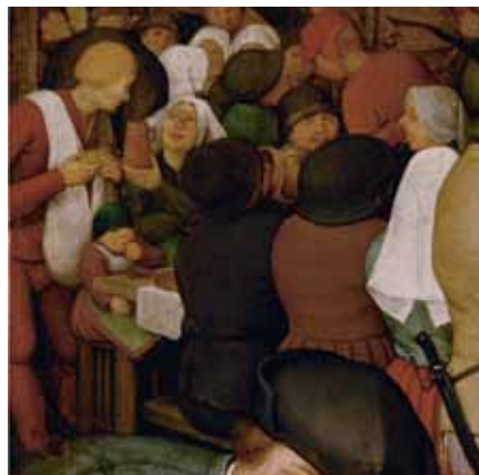
Pieter Bruegel d. Ä., Bauernhochzeit , Detail