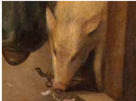
Jan Steen, Die verkehrte Welt , Detail