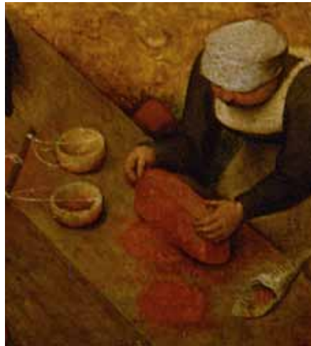
Pieter Bruegel d. Ä., Kinderspiele , Detail