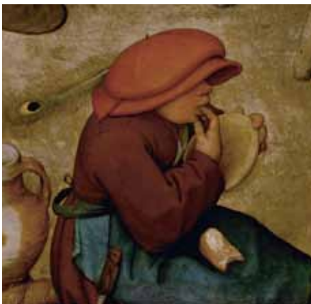
Pieter Bruegel d. Ä., Bauernhochzeit , Detail