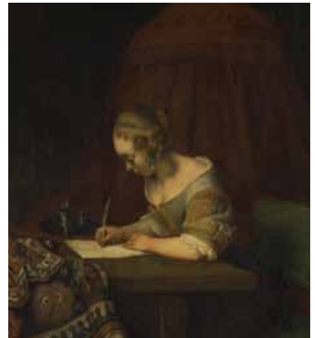
Gerard ter Borch, Die Briefschreiberin , KHM

Die Landkarte im Hintergrund des Raumes zeugt von der Bedeutung Hollands als einem Zentrum der Kartographie des 17. Jhs. Laut Inschrift auf der Karte stellt sie Europa dar. Derartig aufwändig gestaltete Karten waren damals sehr kostspielig und nur in großbürgerlichem Umfeld oder in Rathäusern zu finden. Sie mag wohl als Hinweis darauf zu verstehen sein, dass die Mutter und ihr Kind dem gehobenen Bürgertum angehören. (s. Jan Vermeer van Delft, Die Malkunst , KHM, als Vergleich für eine Wandkarte der 17 Provinzen der Niederlande).