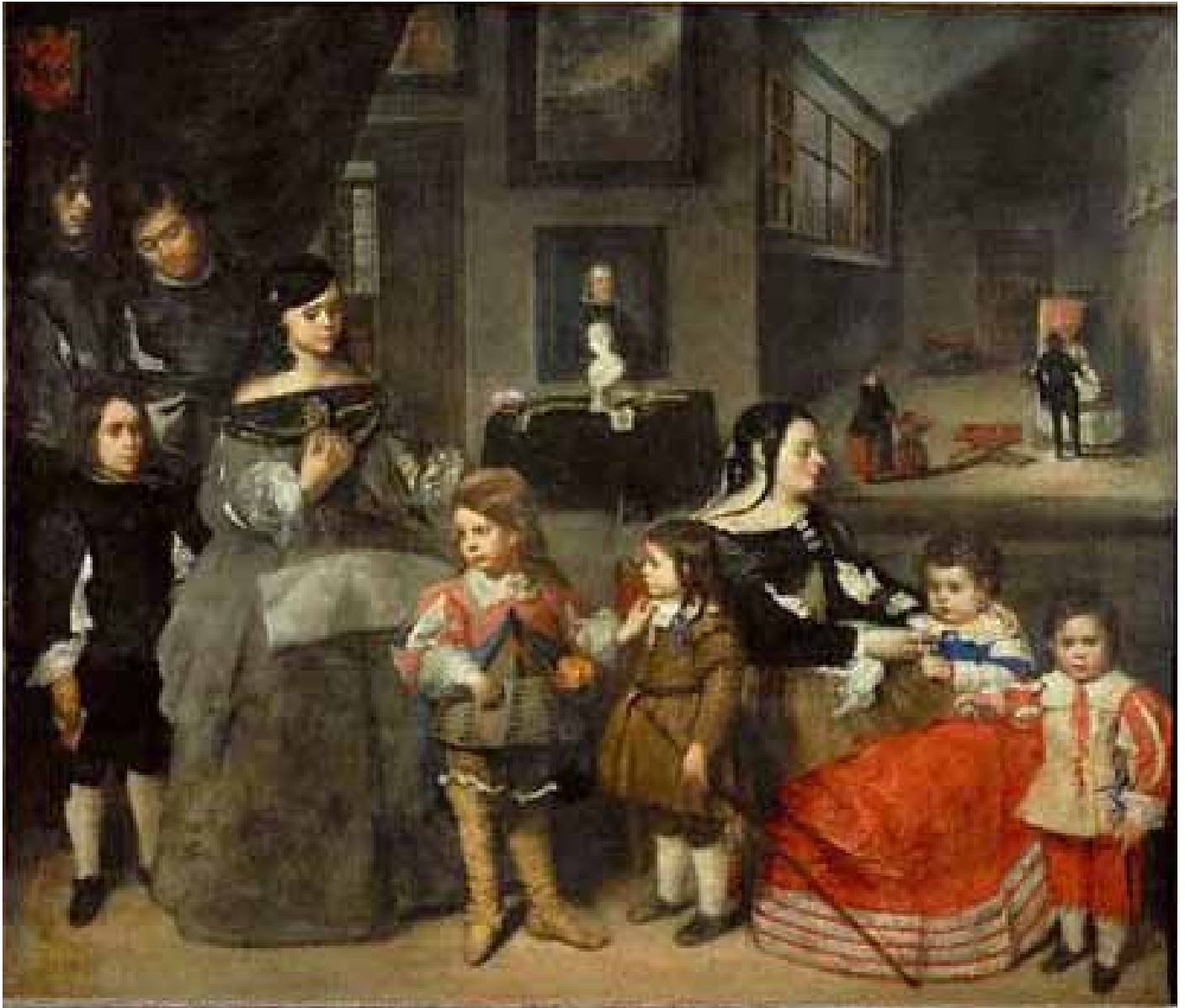
Die Familie des Künstlers