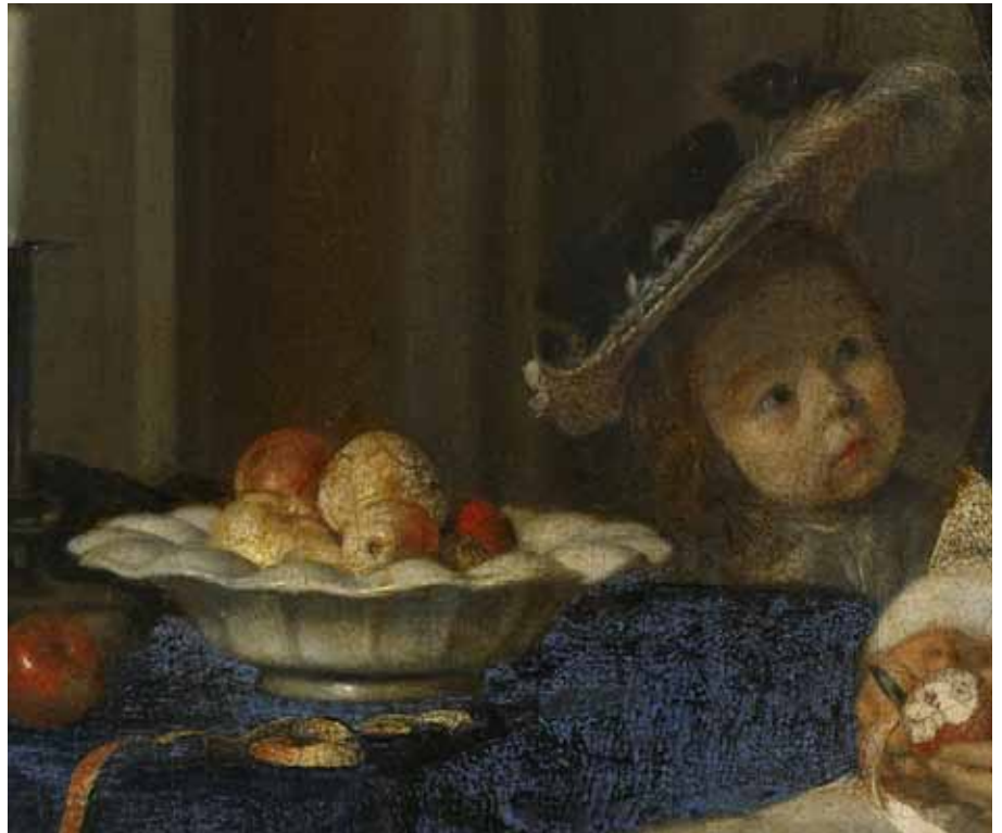
Gerard ter Borch, Apfelschälerin , Detail