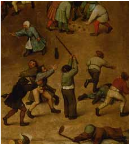
Pieter Bruegel d. Ä., Kinderspiele , Detail