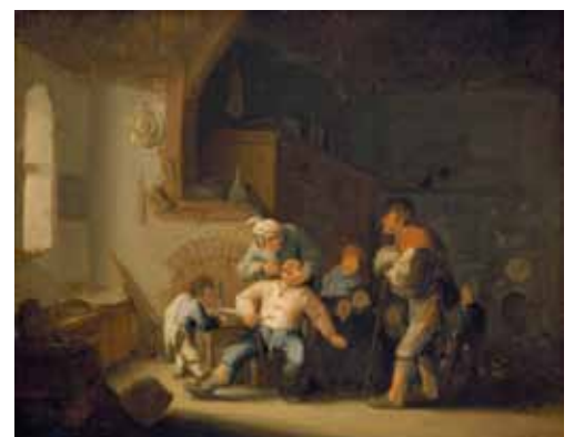
Adriaen van Ostade, Der Dorfbarbier , KHM

Damit wurden sie zum Vorbild für die Entwicklung des Bauerngenres im 17. Jh., das letztlich nicht nur in den südlichen Provinzen, sondern auch im späteren Holland gut vertreten war.