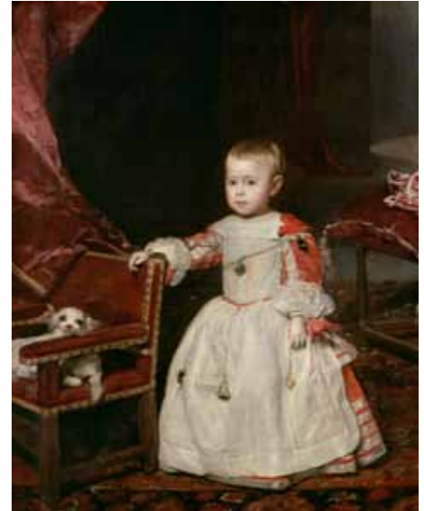
Diego Velázquez, Infant Philipp Prosper, KHM