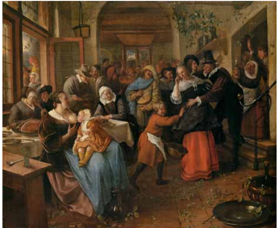
Jan Steen Der betrogene Bräutigam , KHM