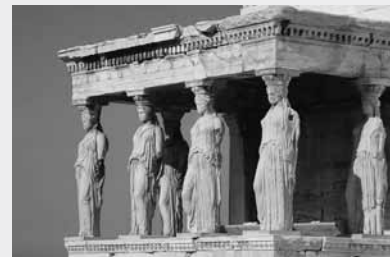
Karyatiden an der Akropolis, Athen

Hin- und Rückflug mit Austrian Airlines (Economy Class), inkl. aller Gebühren. Busfahrten laut Programm. Unterbringung im 4-Sterne-Hotel, inkl. Halbpension (Abendessen und Frühstück) und Ortstaxe.