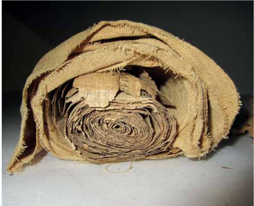
Die in ein Stück Leinen eingewickelte Papyrusrolle aus dem späten Neuen Reich (um 1100 v. Chr.), kurz nach ihrer Entdeckung, KHM, Ägyptisch-Orientalische Sammlung

Die Übersetzung des Textes ergab, dass es sich um eine Art Notiz- oder Kassabuch handelt. Aufgrund der Paläographie, aber auch durch die Nennung von Datumsangaben im Text kann der Papyrus in die