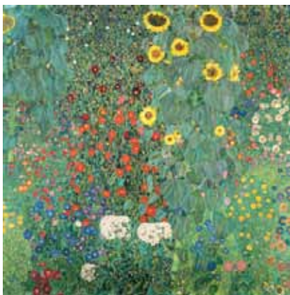
Gustav Klimt, Farmgarten mit Sonnenblumen , 1905–06 © Belvedere, Wien

An Gustav Klimts Leidenschaft für die blühende Natur lassen seine zahlreichen Gartengemälde keine Zweifel. Wussten Sie, dass Klimt nach seinem Bezug des Ateliers in der Hietzinger Feldmühlgasse im Jahre 1911 jährlich andere Blumen anpflanzen ließ, um daraus stets neue Inspirationen für seine Kunst zu beziehen?