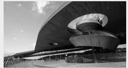
Vigneto Antinori

pro Person im DZ: € 1.650,-; EZZ: € 225,-