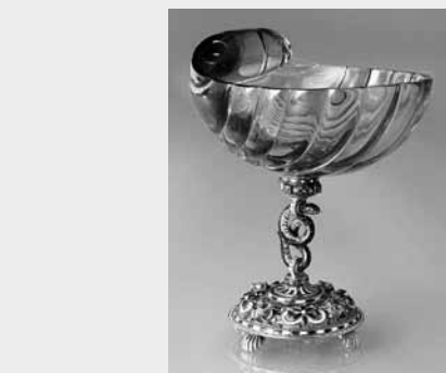
Kleine Schale , Fa. Fabergé, Werkstatt M. Perchin, St. Petersburg, Russland, 1899–1903

Hin- und Rückflug mit Austrian Airlines (Economy Class), inkl. aller Gebühren. Unterbringung in